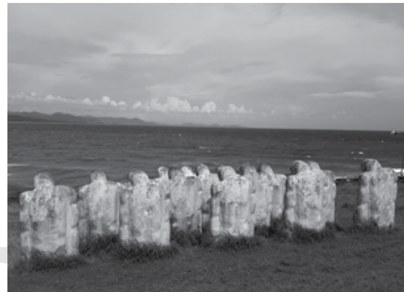
Cap 110, memorial da enseada Cafard, escultura de Laurent Valère, 1998.

Embarcados diretamente do interior das terras, os sofrimentos dos rostos arrancados de seus familiares afluem até o golfo da Guiné. Em Uidá, no atual Benim, olhares agitados espiam através das fendas dos barracões um inesperado horizonte auspicioso. No fim do ano de 1749, 227 buscadores de luz são acorrentados no antro do Espérance [Esperança], navio proveniente do Havre. No inferno atlântico do porão, por trás do medo, do abatimento, dos desejos suicidas ou dos sonhos de vingança, uma pulsação surda conserva a esperança de um encalhe numa terra acolhedora. Em 15 de fevereiro de 1750, o Espérance naufraga ao largo de Le Vauclin, na Martinica. Desembarcados naquela areia desconhecida, 177 náufragos do Espérance já procuram, através das fendas dos morros ainda verdejantes, as possíveis aberturas de um mundo.