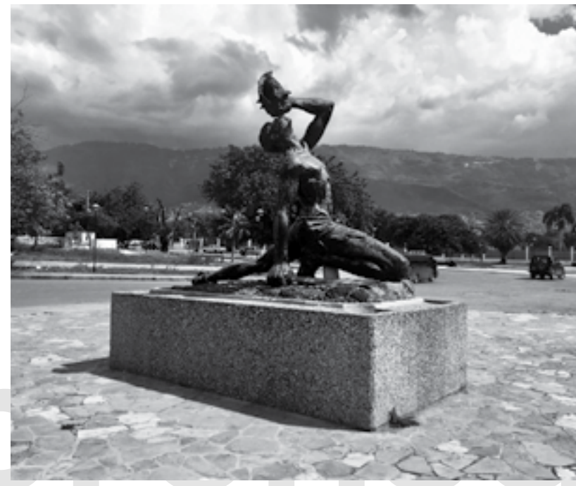
Estátua do quilombola desconhecido em Porto Príncipe, Haiti (Albert Mangonès, 1968).

Em 3 de setembro de 1706, o Escape [Fuga] deixa Barbados em direção à costa africana e suas riquezas Pretas. Em um porto desconhecido pelos arquivos, 151 vidas são acorrentadas no porão, destinadas a rastejar nas plantations coloniais. O peso das correntes marcou o início das corridas desenfreadas rumo a um alhures marinho, das buscas revoltadas de corpos metamorfoseados e das fantasias de um retorno aos países rememorados. Como os demais negreiros, o Escape já carregava em seu ventre a gênese quilombola das fugas por vir. De volta a Barbados em 15 de maio de 1707, 121 desejos ambulantes foram desembarcados com a forte convicção de que, por trás da arrogância das plantations , persistem a possibilidade de um outramente [ autrement ], os traços de uma Mãe Terra e o horizonte de um mundo.