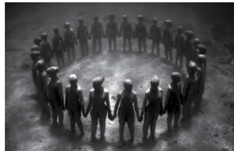
Escultura Vicissitudes , de Jason deCaires Taylor, Granada, 2006. © Jason deCaires Taylor/DACS/Artimage Adagp, Paris, 2019.