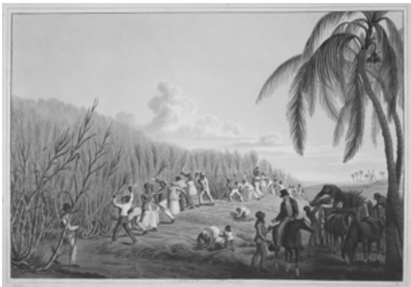
William Clark, Cutting the Sugar Cane [Cortando cana-de-açúcar], in Ten Views in the Island of Antigua . London: Thomas Clay, 1823.

No centro do habitar colonial da Terra encontra-se a plantation . Já testada na Ilha da Madeira no século XV, 1 a plantation recobriu com seu manto de algodão, de índigo, de café e de açúcar as planícies e morros das ilhas caribenhas. Sistema violento, patriarcal e misógino, a transformação forçada das ilhas caribenhas em quebra-cabeças de plantações traduziu-se pela destruição ambiental massiva, uma verdadeira “revolução biológica” que abalou os ecossistemas anteriores a 1492. 2 Contentar-se em enumerar os diferentes “impactos ambientais” da plantation um após o outro nos manteria nessa dupla fratura da modernidade. As destruições causadas seriam realmente “ambientais” diante de um fundo sociopolítico realmente “humano”. Cuidar dessa dupla fratura exige que se identifiquem as relações desenhadas por tais destruições que unem os humanos (colonizadores, escravizados, autóctones) e os não humanos. O habitar colonial é: uma engenharia ecológica das paisagens da Terra em plantations , beneficiando colonizadores europeus, o que Alfred Crosby chama de imperialismo ecológico ; 3 um imperialismo socioeconômico e político que subjeta